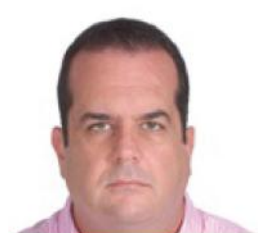
RAFAEL URIBE TORO